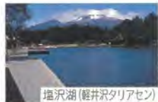
塩沢湖(軽井沢タリアセン)